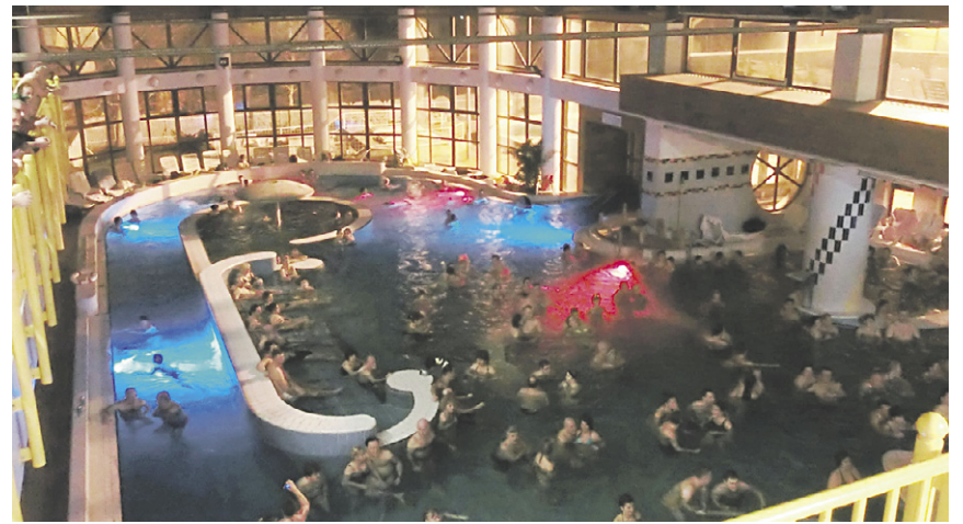
Ein sehr großes, ausgezeichnet besuchtes Fest mit musikalischen Stargästen und Miternachts-Feuerwerk war die Silvesterparty im Heilbad in Zalakaros.

Drei Stunden von Budapest entfernt, im Osten des Landes, entspannen Urlauber in Bad Nyíregyháza. Hier laden fünf moderne Thermalbäder zum Erholen ein. So wartet beispielsweise inmitten eines Eichenwaldes ein Salzsee (Sóstó) auf Besucher. Während die östliche Hälfte des „Freibads am See“ nur für Boote freigegeben ist, schwimmen Besucher im südlichen Teil des Sees ohne Bedenken. Das „Aquarius-Bad“ bietet auf 1,7 Hektar generationenübergreifenden und barrierefreien Badespaß. Sechs Becken inklusive Poolbar, Jacuzzi und Rutschen, stehen im 2011 renovierten „Parkbad“ zur Verfügung. In historischem Ambiente relaxen Urlauber und Einheimische im „Sóstó Badehaus-Pension“. Im ersten Heilbad von Bad Nyíregyháza können Gäste in den an das Thermalbad angeschlossenen Zimmern und Apartments übernachten. Zentral in der Innenstadt gelegen, empfängt das „Júlia-Bad“ auf 6.500 Quadratmetern seine Gäste. Fitness im Thermalwasser und wohltuende Saunagänge stehen hier im Mittelpunkt. Weitere Informationen unter de.gotohungary.com