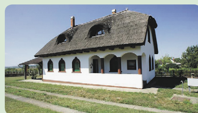
In Újireg, Nähe Thermalbäder Tamási u. Dombóvár, Wohnhaus (80 m 2 ), 4 Zi., guter Zust., Gas-ZH, Grund 892 m 2 zu verk., Preis..... 58.000,- EUR Code: 945

Ausführliche Infos in unserem Büro in Siófok , Fő tér 5 (Erdgeschoss 6)