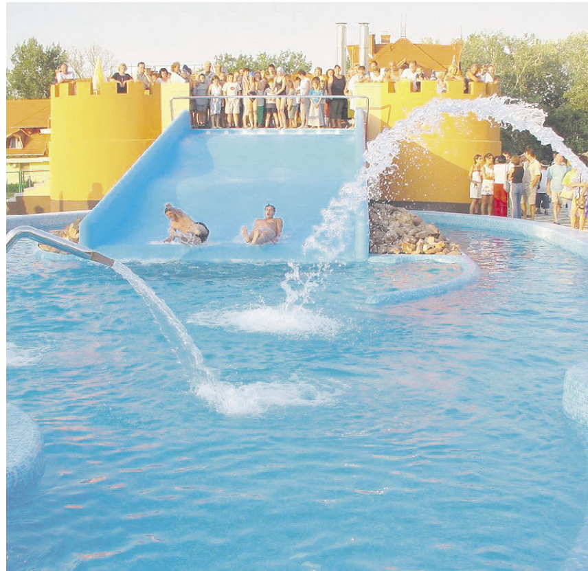
Balatonlelle hat sich mit zahlreichen Pensionen, Hotels und 1700 Privatunterkünften, kostenlosen Parkplätzen, guter Infrastruktur und nicht zuletzt mit einem einzigartig langen Sandstrand und tollen Erlebnisbad zum Geheimtipp am Süd-Balaton entwickelt. Die neue Rutsche findet bei Alt und Jung besonders viel Anklang.

Internet-Tickets können bei MÁV-START bereits seit 2008 gebucht werden. Von Jahr zu Jahr nehmen mehr Reisende diese Möglichkeit in Anspruch. In Zügen mit Zuschlag, z.B. in den Inter-city-Zügen, müssen die Tickets bei Fahrkartenschaltern nicht mehr in gedruckter Form vorgelegt werden, sondern können mit Hilfe des QR-Codes auf dem Laptop oder Telefon vorgezeigt werden.