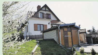
In Kötse , modernes, komfortables Wohnhaus (100 m 2 ) in herrlichem Panoramaumfeld zu verkaufen. Grund: 1500 m 2 , Preis... 52.000,- EUR Code: BAR061