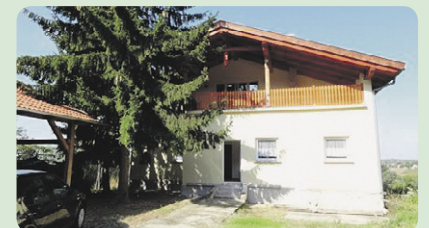
In Pincehely , individuell konzipiertes, komfortables Wohnhaus (209 m 2 ) mit Fischteich zu verkaufen. Grundstück: 12.000 m 2 , Preis ..... 79.000,- EUR Code: BAR130